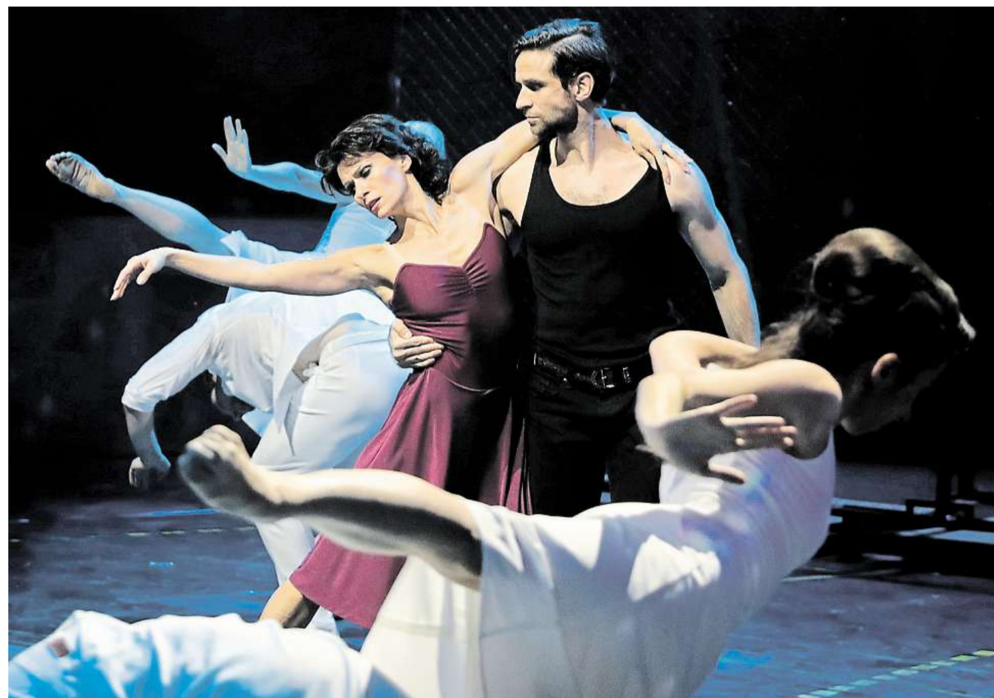
Tanec na výstavišti Tak vypadá West Side Story na hudbu skladatele Leonarda Bernsteina v choreografii režiséra Mária Radačovského.

Duchu hokejové haly odpovídají ovšem i sedačky, u nichž divák pochopí propozici, že se zde nevyžaduje žádný pumprdentní dress